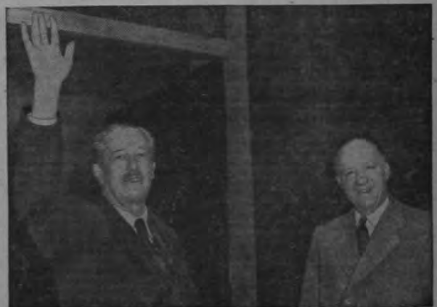
El señor Harold Macmillan, Primer Ministro británico, saluda al público en Downing Street al regresar de las Bermudas, donde celebró conversaciones con el Presidente Eisenhower y el Primer Ministro del Canadá, señor St. Laurent. Le acompaña el señor Butler, Ministro del Interior y Lord del Sello Privado de Gran Bretaña.