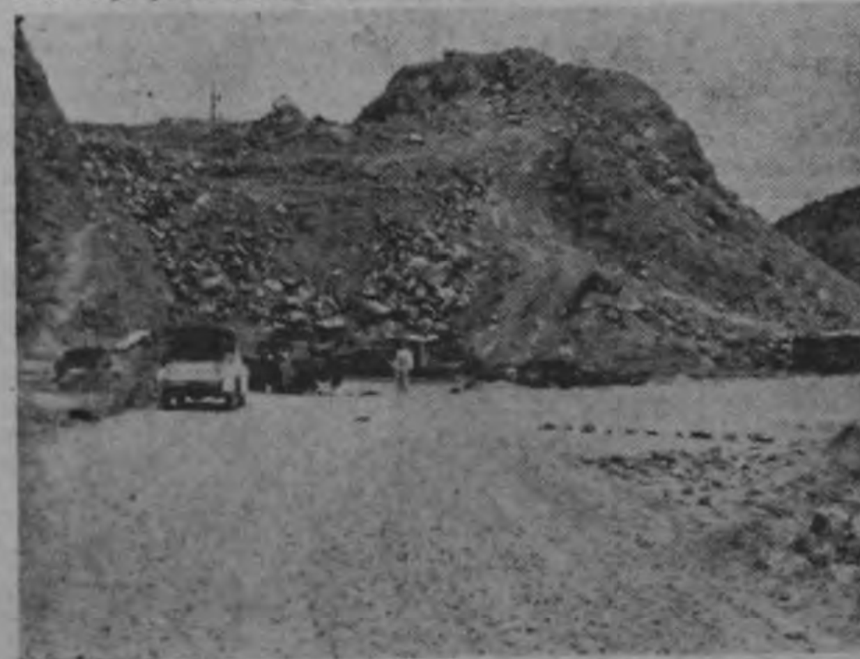
La roca Cambroneiro también entre San Ramón y Barranca es tá ocasionando uno de los movimientos de tierra más grandes del trayecto. Será necesario movilizar 40 metros cúbicos de roca para eliminar ese obstáculo.