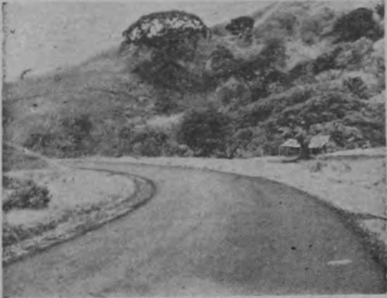
La fotografía muestra un aspecto de la carretera Interamericana ya asfaltada en un lugar cerca de Macacona, del trecho entre San Ramón y Barranca.

Servicio Informativo de la International News Service. Representante en EE. UU.: Melchor Guzmán Inc. Representante en Inglaterra: Atlantic Pacific Representations. Gerencia de Anuncios y Económicos: 7294 - Apartado 2130. Suscripción en el país: $ 5.00 mensuales. Teléfonos: Suscripciones y Agencias: 1011. - Dirección y Gerencia: 1014. La colaboración será solicitada, no se devuelven originales de artículos.