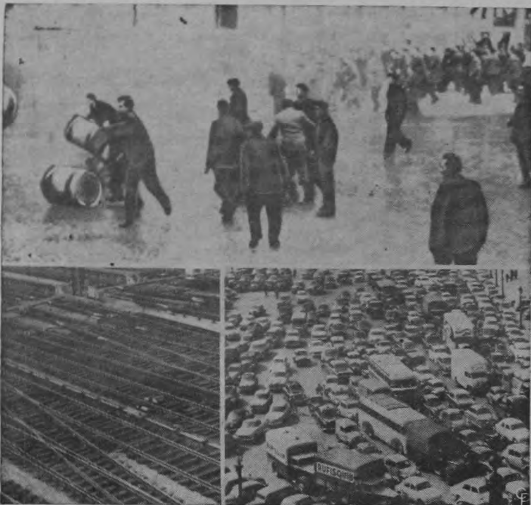
Los obreros en huelga de ferrocarril, omnibús y subterráneo combaten en París con la policía en el boulevard frente al Ministerio de Transportes y Obras Públicas. Rociados por los gendarmes con mangueras contra motines, los huelguistas en primer término lanzan barriles vacíos a los policías. Otros usaron cabillas de metal y piedras para tratar de llegar al Ministerio. Las fotos de abajo muestran a París durante la huelga que paralizó el 90 por ciento de los transportes públicos. A la izquierda una red de vías vacías. Toda clase de vehículos fueron usados dando por resultado congestiones de tránsito como la que se ve a la derecha