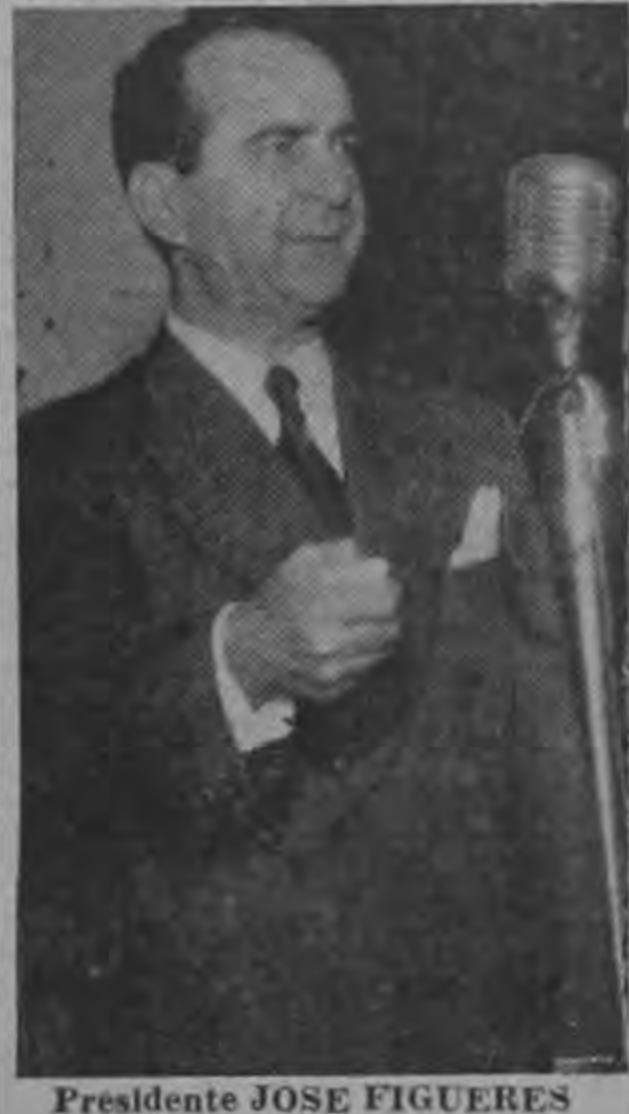
Presidente JOSE FIGUERES

Pero en este asunto que ahora se debate, los señores Magistrados se han pronunciado como Tribunal, definiendo una cuestión jurídica que sólo a ellos corresponde decidir. Esa opinión debe ser final para nosotros, mientras la Ley esté como está. Mi deseo es que el prestigio del Tribunal salga robustecido de esta consulta que ha resuelto, aun ante las personas que puedan sustentar una tesis contraria. (PAGINA 10)