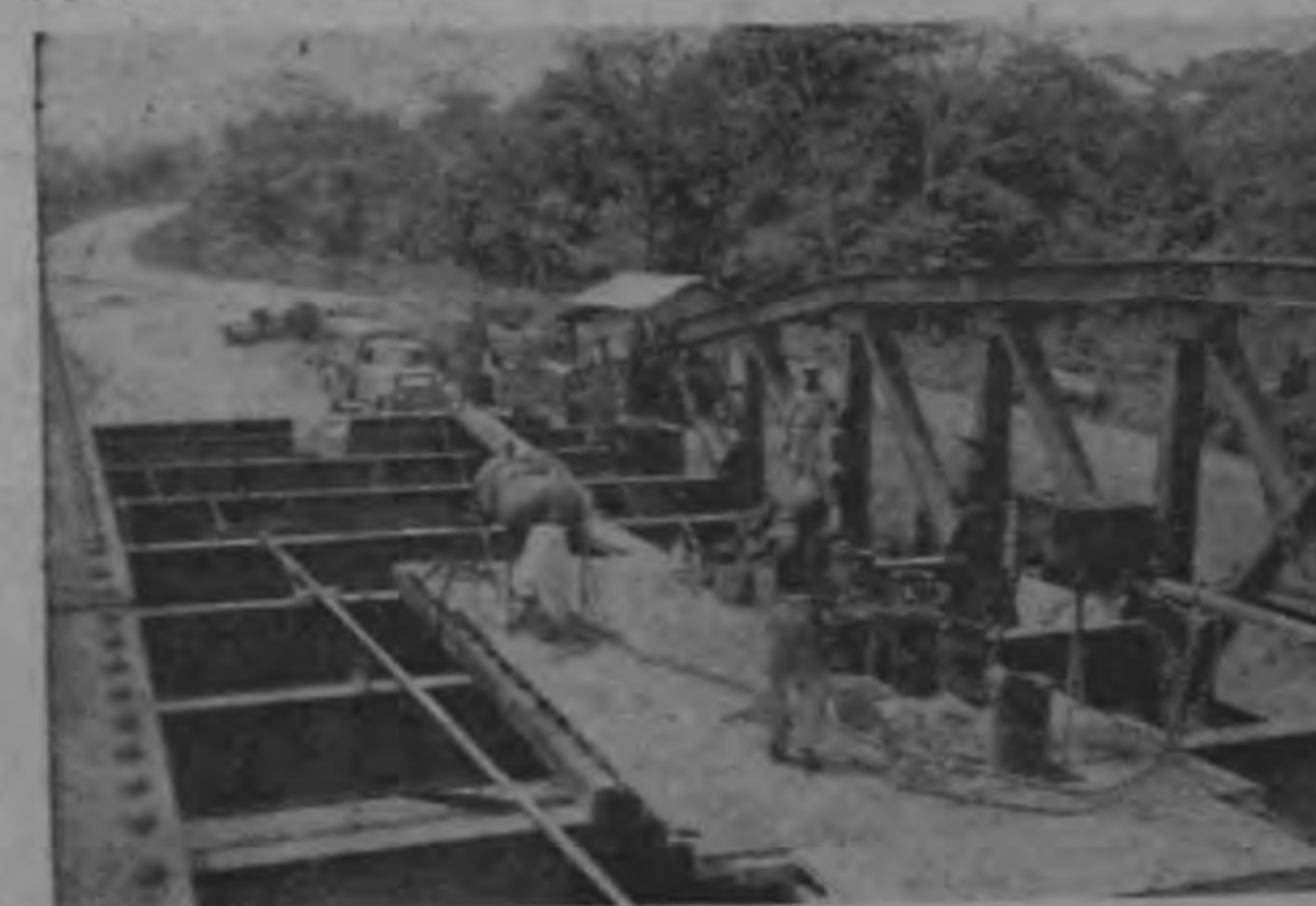
Una cuadrilla del campamento termina la armada del puente Potrero, uno de los 16 puentes que están en proceso de construcción más allá de Lagarto.

En 1955 el entonces Ministro de Obras Públicas, Sr. Francisco Orlich, gestionó con el Eximbank un empréstito de 9 millones de dólares destinados a la Carretera Interamericana en Costa Rica. Esa suma se emplearía para terminar la carretera desde San Ramón a la frontera con Nicaragua y abrir o iniciar los trabajos de la carretera hacia el Sur. El Empréstito se consiguió para ser pagado en un plazo de 15 años y con él se financiaría la tercera parte del valor de la obra que corresponde pagar al Gobierno costarricense. Al llegar el asunto a discusión en la Asamblea Legislativa este encontró desde luego la oposición más decidida del Lic. Echarri Jiménez, quien ignorando que en el mercado internacional el interés sube o baja de acuerdo con la demanda mayor o menor que exista, trató de objetar que se efectuará el empréstito.