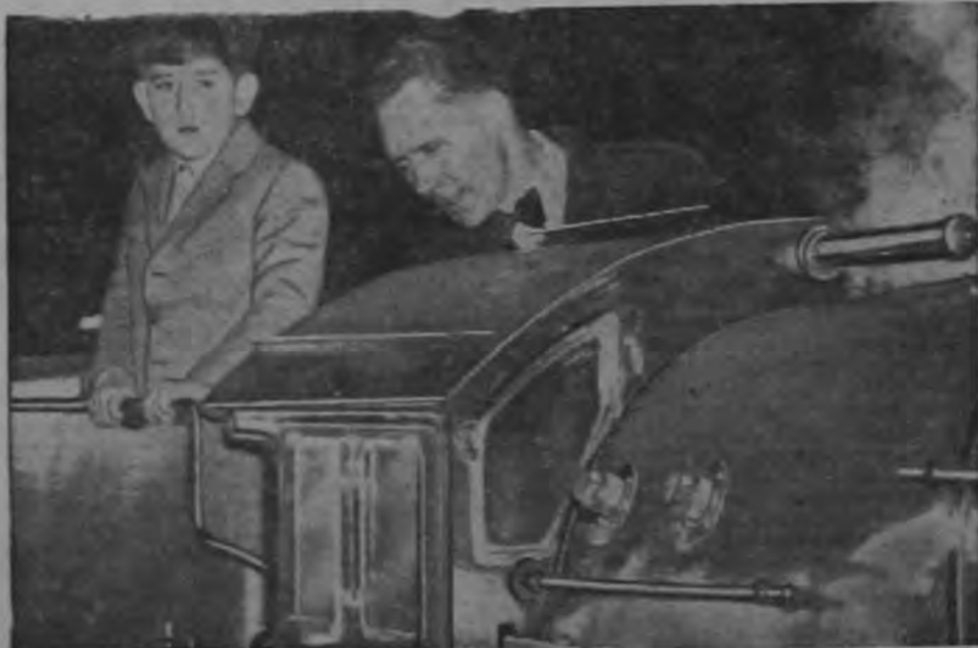
El Príncipe Carlos y su hermana la princesa Ana visitaron recientemente el menor ferrocarril de servicio público del mundo: el de Rommney, Hythe y Dimchuch. Acompañados de la reina y el príncipe Felipe, viajaron en un coche especial desde Romney hasta Hythe, una distancia de unos 15 kilómetros, actuando por turnos como fogoneros en la cabina de la pequeña locomotora, "Hurricane". En la fotografía aparece el príncipe Carlos al lado del maquinista.