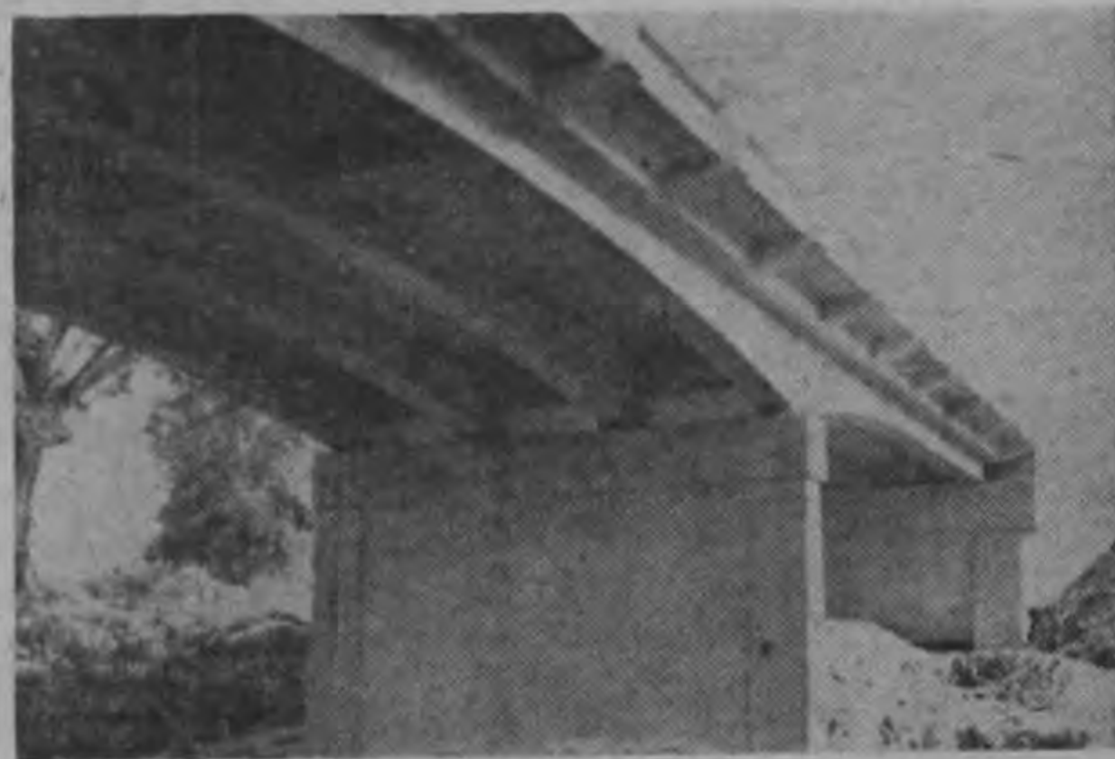
El Puente Irigaray fue uno de los primeros en estar en funcionamiento figurando entre los 10 construidos del total de 29 que tiene todo el proyecto hasta la frontera con Nicaragua.